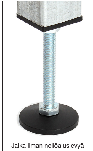
Jalka ilman neliöaluslevyä