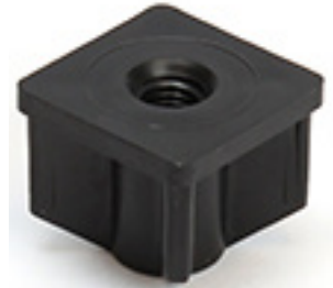
Pohjatulppa 40 x 40 mm

Käytä osien ja kierretulppien kokoamisessa ainoastaan kumi- tai muovinuijaa, ei koskaan teräsvasaraa.